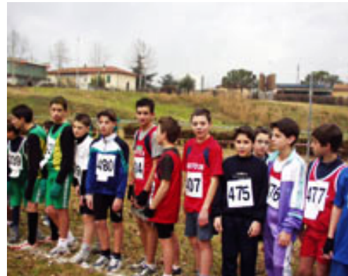
Partenza della campestre di Fucecchio