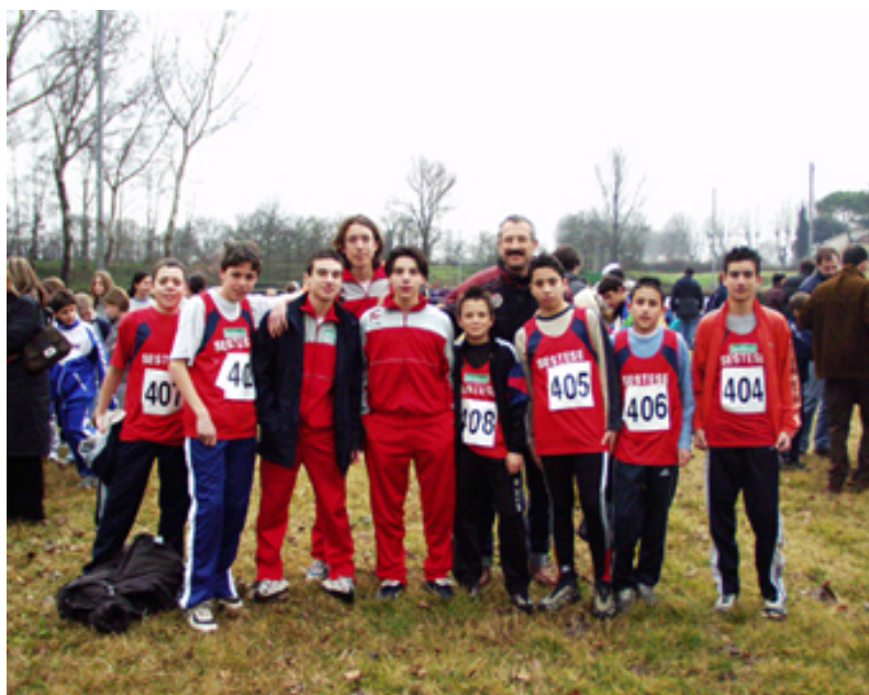
Il gruppo di Cadetti e Ragazzi Vincitori del Titolo Regionale di Società di Corsa Campestre a Fucecchio